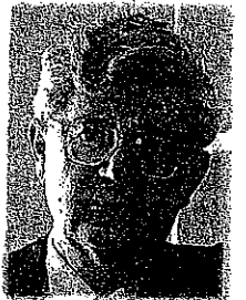
פרופ' אהרון ברק הוא נשיא בית המשפט העליון

אני אומר זאת לא כביקורת. כאשר למדתי משפט חוקתי באוניברסיטה העברית, לימדו אותי