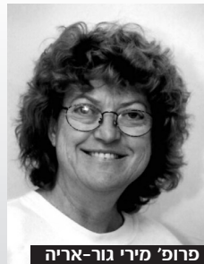
פרופ' מירי גור-אריה

● פרופ' סיליה פסברג סיימה את תפקידה כראש מכון סאקר למחקרי חקיקה ולמשפט השוואתי לאחר חמש שנים שבהן כיהנה