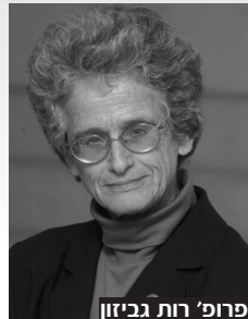
פרופ' רות גביון

▲ פרופ' רות גביון תקבל את פרס א.מ.ת. - פרס האמנות, המדע והתרבות - המוענק ע"י קרן א.מ.ת. בחסות ראש ממשלת ישראל. הפרס מוענק בכל שנה לאמנים, למדענים וליוצרי תרבות על הצטיינותם ועל הישגים אקדמיים או מקצועיים שיש בהם תרומה מיוחדת לחברה והשפעתם מרחיקת לכת. הקרן רואה בפרס אות והוקרה לעושים את המצוינות לדרך חיים ורואים במיצי היכולות האישיות ציווי ליצירת