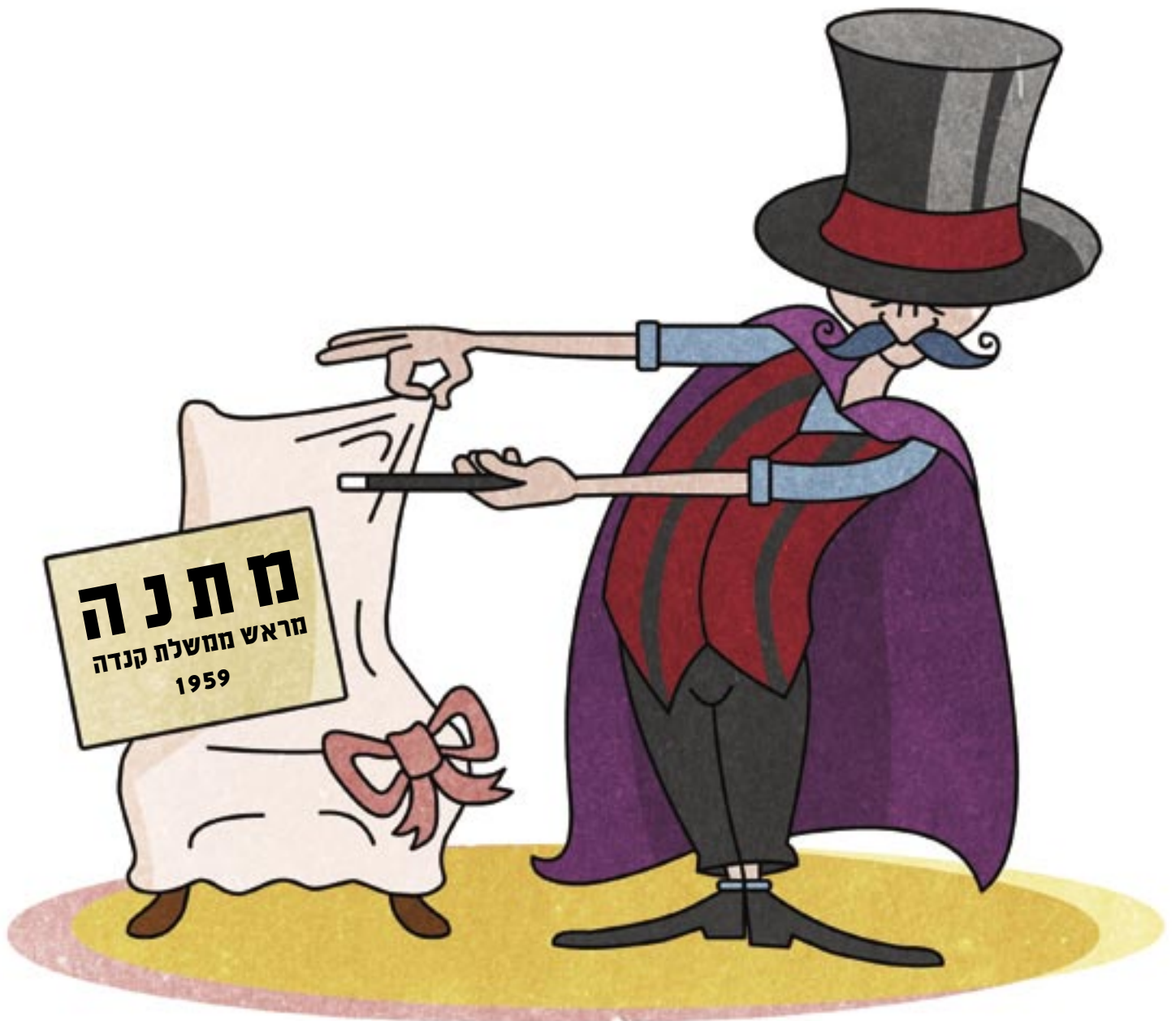
איור: סטודיו פליירס, אלירן ביכמן

זו הייתה תרומה שולית, לכאורה, ולא שימושית במיוחד: כיסא מהגוני כבד ומגולף, מספרייתו של ראש הממשלה ושר המשפטים הראשון של קנדה, סר ג'ון מקדונלד