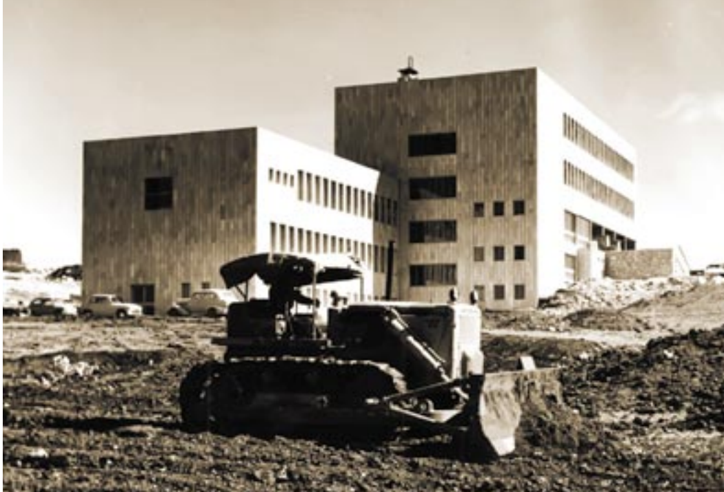
בניין הפקולטה למשפטים בגבעת רם, 1959

בהמשך פרש לבונטין את השקפתו הפדגוגית. לדבריו, "כיוון שנופלת המחיצה בין מחקר להוראה, עשויה ההוראה להקנות למתלמד את תחושת המיידיות שבינו לבין הדיסציפלינה האינטלקטואלית שבה חשק. תחושת מיידיות זו היא לימוד שנעשה לא מפי שמועה רחוקה ולא מאת רשות מוסמכת כביכול, אלא לכל היותר בעזרת כלים אלו ותמיד אגב ההתחדשות הנמשכת מטבילה במי המעיין עצמו. תחושה זו - היא היא הנכס היקר ביותר שבכוח האוניברסיטה להנחיל לתלמידיה". בניגוד ל"בניין הקבע" בגבעת רם, שאותו נטשה הפקולטה לאחר אחת עשרה שנה בלבד עקב מעברה להר הצופים, דברים אלו, על הגישה האקדמית של הפקולטה, לא נתיישנו כלל.