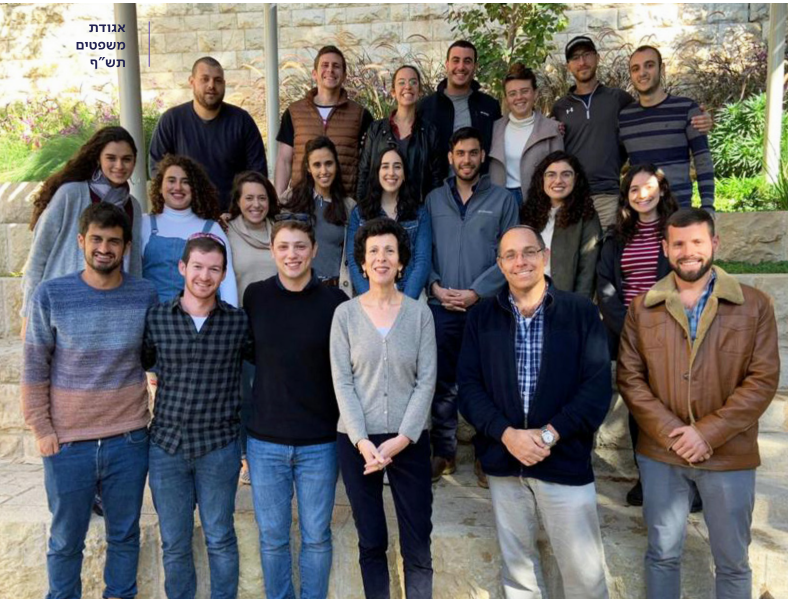
אגודת משפטים תש"ף

"תמיד אהבתי ספרות. במשך כמעט עשרים שנים למדתי מהר, (בין אם בהתמחות או בשירות הצבאי בגלי צה"ל) הגבתי מהר וניסחתי מהר. משהו בי רצה לחשוב על מילים שיש להן יותר זמן להתגבש, להסתכל על