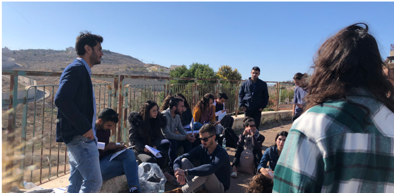
חשוב שסטודנטים יבינו שיש אחריות חברתית שנלווית לגלימה. חברי הקליניקה בסניף למזרח ירושלים.

עצמי הולך עם פונה ממזרח ירושלים למשרד הפנים, ונתקל לראשונה באפליה הזו שכל הזמן מדברים עליה. זה חשף אותי לתרבויות שונות ואיתן גם מצוקות שונות, אני מרגיש שפתאום אני רואה תמונה רחבה יותר על המדינה והחברה שלנו, וזה השיעור המרכזי שקיבלתי מהקליניקה."