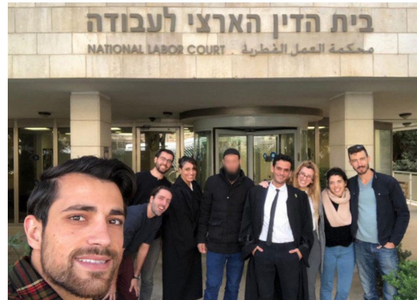
השיעורים עוסקים במתן ארגז הכלים לעורך דין החותר לשינוי חברתי. חברי הקליניקה.

המוקדים נותנים מענה לאוכלוסיות שנמצאות בשוליים החברתיים. יש לנו מוקד בשכונה החרדית נווה יעקב; במרכז קליטה ליוצאי אתיופיה; במזרח ירושלים על מנת לתת מענה לאוכלוסייה הערבית בעיר; בשכונת הקטמונים ישנו מוקד ייעודי לאימהות חד הוריות; מוקד נוסף בשכונת קריית מנחם; והמוקד השישי נמצא בבית המשפט