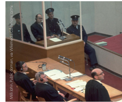
מחקרה מעניק יחס שוויוני לכל העדים, למשל במשפט איוכמן.

למעלה מחצי שנה שמגפת הקורונה מהווה חלק בלתי נפרד מחיינו. ניכר כי לפחות כרגע, המגפה עדיין כאן ואיתה ההגבלות השונות המוטלות עלינו האזרחים. איך בכל זאת מצליחה להתנהל הפקולטה תחת המגפה? והאם ישנם גם דברים חיוביים שצמחו מתוכה?