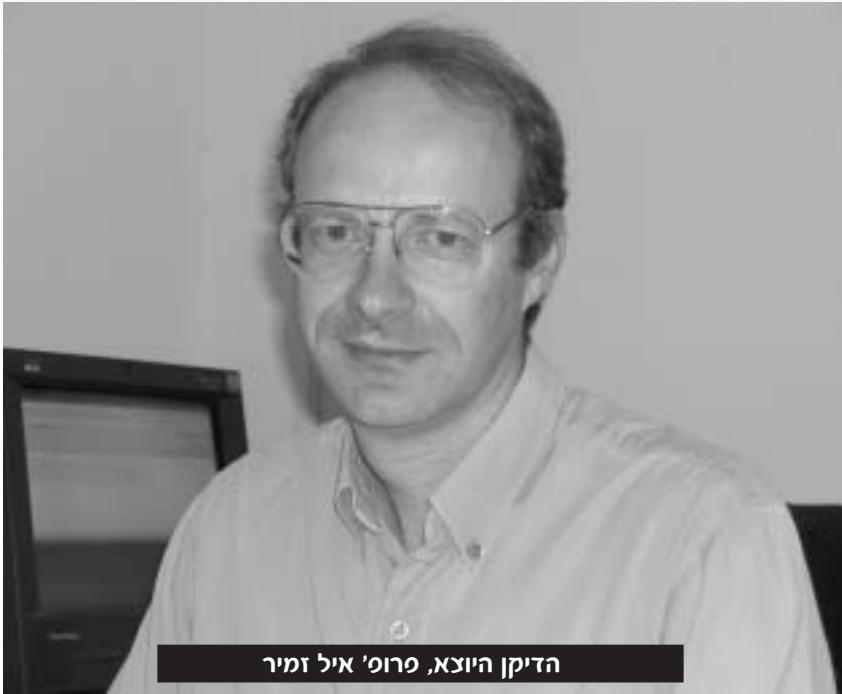
הדיקן היוצא, פרופ' איל זמיר

על מגדל שן עם חלונות רחבים לעולם החיצוני. להנהלת הפקולטה אין השפעה משמעותית על חברי הסגל. כל חבר סגל נוהג לפי הבנתו. בפקולטה שלנו יש לא מעט אנשים התורמים לדיון הציבורי-משפטי בחברה הישראלית, למשל פרופ' רות גביון, פרופ' מרדכי קרמיניצר ופרופ' דוד קרצ'מר. אני עצמי חושב שזו תופעה חיובית ביותר.